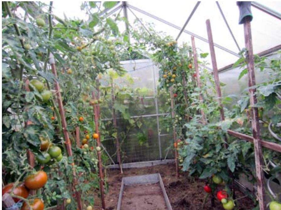
Tomaten im Gewächshaus sollen luftig stehen und schnell abtrocknen.

Gerade in feuchten Sommern ist der Infektionsdruck durch Pilzkrankheiten hoch. Da wir keine Fungizide verwenden, hilft nur Vorbeugen.