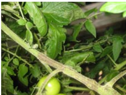
Sind bereits die Tomatenstängel mit Braunfäule befallen, ist die Staude nicht mehr zu retten. Bei ersten Anzeichen die befallenen Blätter entfernen.

Die meisten Pilzkrankheiten treten bei feuchter Witterung auf. Die Krautfäule ( Phytophthora infestans ) bei Kartoffeln und Tomaten tritt bei Temperaturen um 20 Grad auf. Die winzigen Sporen dringen in die nassen Blätter ein und nach wenigen Tagen verstreuen sie schon wieder Sporen.