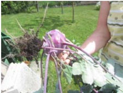
Kohlrabiernte im Juli

Häuptelsalat verziert mit bunten Blattsalaten den Mittagstisch. Radieschen oder Rettiche ergänzen die Jause. Kohlgewächse wie Kohlrabi, Karfiol, Brokkoli sowie Frühkraut und Frühkohl sind auch laufend zu ernten und sind so vielseitig verwendbar.