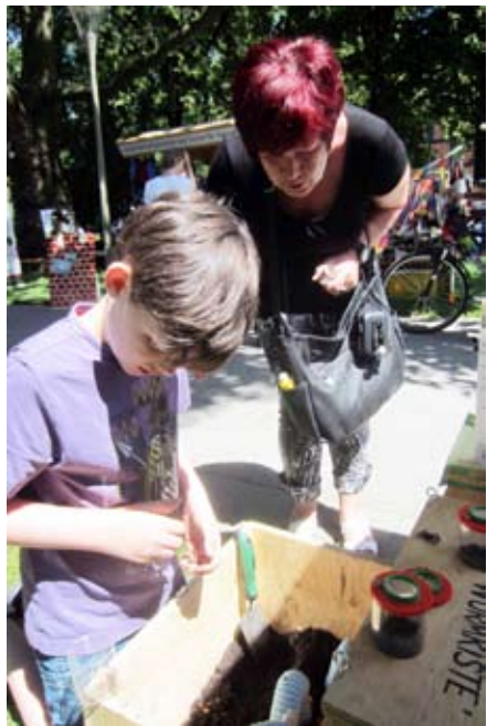
Ganz eifrige und begeisterte junge Naturforscher wühlten in unserer Wurmbox und fanden Tiere, die wir gar nicht hineingegeben hatten.

Viele Naturschutzorganisationen präsentierten sich im Linzer Volksgarten. Wir waren mit den Themen „Kein Gift im Garten“ und „Das Bodenleben fördern“ vertreten.