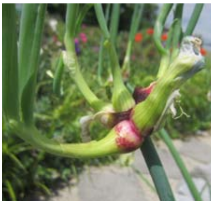
Etagen- oder Luftzwiebeln

Zwiebeln: Die Zwiebelernte ist im Juli recht vielseitig. Sehr begehrt sind frische Jausenzwiebeln.